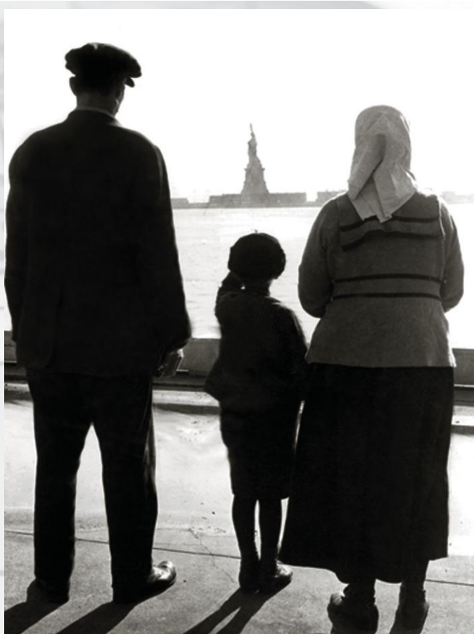
Koutwazi Biwo Istwa ak Bibliyotèk USCIS la