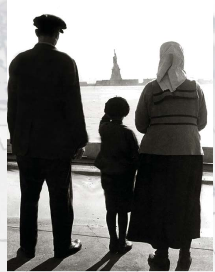
بموافقة مكتب محفوظات ومكتبة مصلحة خدمات الجنسية والهجرة الأمريكية (USCIS)

الاتصال على الرقم 1-800-375-5283 أو http://www.uscis.gov/asylum